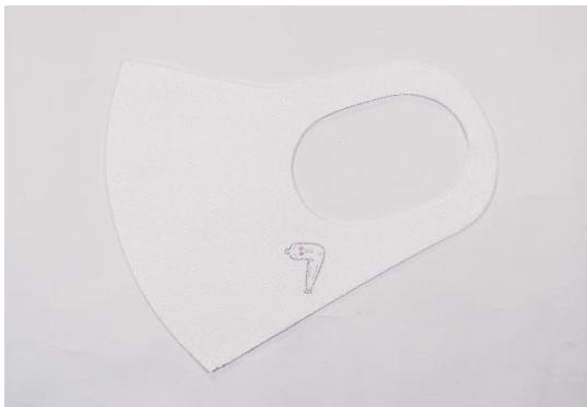
ビジネス用にもおすすめの「白」