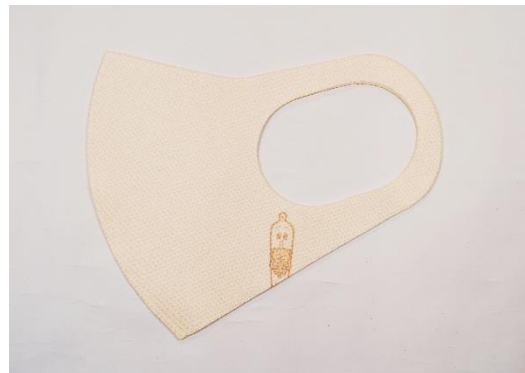
かわいらしく温かみのある「クリーム」